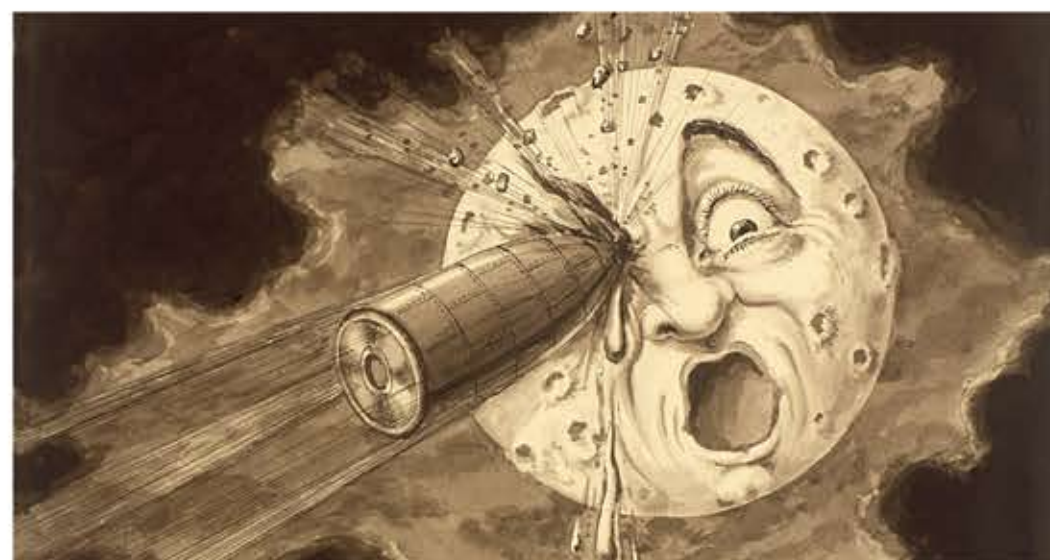
Georges Méliès - Le Voyage dans la Lune - En Plein dans L'oeil (9ème tableau) © ADAGP, Paris 2008.

Préambule le 4 novembre à 9h30 avec la projection du film Wall-E . Ce film d'animation ambitieux, des studios Pixar, a été unanimement salué par la critique. Sur réservation, 20 enfants pourront participer à un goûter suivi d'un atelier philo de 11h15 à 12h30. Gratuit. Réservation auprès du Ciné Le Parc.